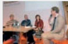
BILDUNGSFORUM in Halle 3.1