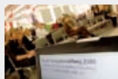
FORUM VERLAGSHERSTELLUNG in Halle 4.0

Mit freundlicher Unterstützung des Nachrichtenmagazins FOCUS