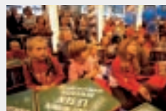
FORUM KINDER- UND JUGENDBUCH in Halle 3.0

Es gelten andere Konditionen. Informationen erhalten Sie auf www.buchmesse.de/foren oder unter Tel.: +49 (0) 69 21 02-144