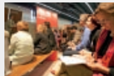
FORUM INNOVATION in Halle 4.2

Mit freundlicher Unterstützung des Nachrichtenmagazins FOCUS