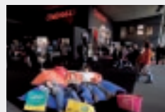
FORUM FILM & TV im Forum, Ebene 0