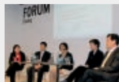
FORUM DIALOG in Halle 6.1