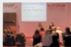
FOCUS FORUM SACHBUCH & LITERATUR in Halle 3.1

Mit freundlicher Unterstützung des Nachrichtenmagazins FOCUS